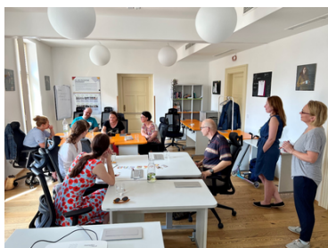
WS v Praze

V červnu jsme uskutečnili workshop „Jak (z)vládnout svoji (ne)moc“ v Praze. V září proběhl workshop „Komunikace (ne)jen s lékařem“ opět v Praze v Pacientském hubu.