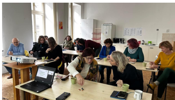
WS v Brně

https://www.revmaliga.cz/workshopy/komunikace-s-lekarem-workshop/