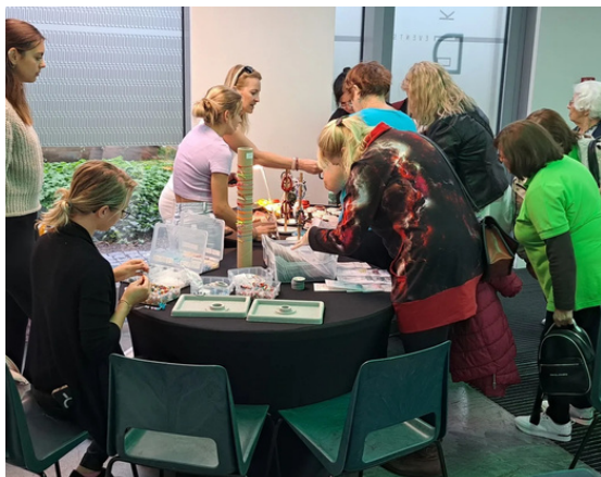
Artrináramky na SDA

Již před odstartováním akce, jež bylo stanoveno na 10. hodinu, se před Spojkou začala tvořit fronta a my byli rádi, že pozvání na naši akci lidé zaznamenali a přišli buď pro lékařskou radu nebo Revma Ligu a tuto "oslavu" Světového dne podpořit svou účastí. Zájemci o odbornou konzultaci dostali pořadové číslo s časem, kdy se k požadovanému "vyšetření" mají dostavit. Fronta se tedy poměrně brzy rozpustila ve vnitřních prostorách kongresových sálů, kde bylo pro čekající připravené občerstvení a tiskové materiály. Lidé také mohli shlédnout naše edukační videa či se zabavit navlékáním či koupí náramků. Artrináramky podporující děti s artritidou.