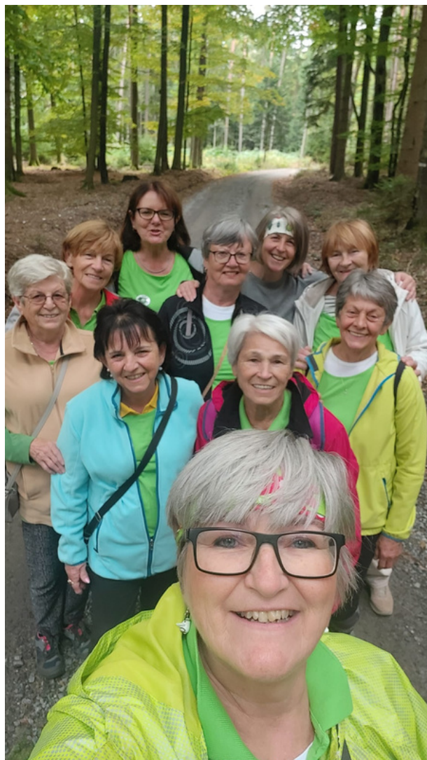
Na procházce lesem