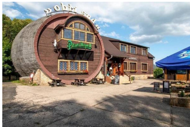
Restaurace Obří sud