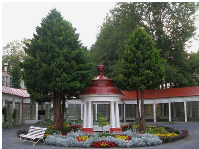
Část lázeňské kolonády

V roce 1779 navštívil lázně rakouský císař Josef II a od zač. 19. stol. již měly takový věhlas, že sem jezdily „celebrity“ jako byl Carl Maria von Weber, Josef Jungmann, později pak Franz Kafka, Alexander von Humboldt nebo Jan Masaryk.