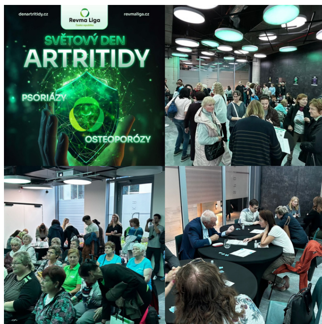
Foajé, promítací sál, místnost pro konzultace s lékaři, Praha 8. 10. 2023