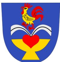
Znak obce Libverda

Zdejší léčivé prameny byly známy snad již na konci 14. století. Dle legendy je zde objevil kohout místního hájníka, který k nim chodil každý den pít a velmi po nich sílil a prosperoval. Dnes se jejich voda využívá především k léčebným koupelím, ale přiměřená pitná kúra prospívá i při zažívacích, ledvinových a cévních potížích.