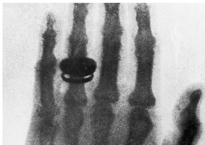
První rtg snímek, ruka Röntgenovy manželky s prstenem

Byl laskavý a zdvořilý, vždy chápal názory a potíže druhých. Byl velmi pracovitý, ostýchal se mít asistenta a raději své experimenty prováděl sám.