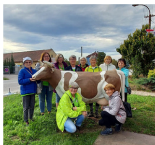
U prodejny v Mláce