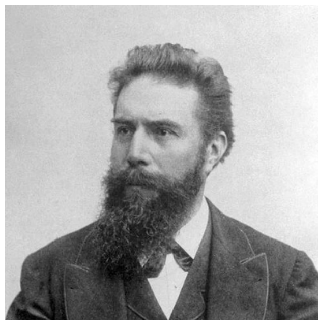
Wilhelm Conrad Röntgen