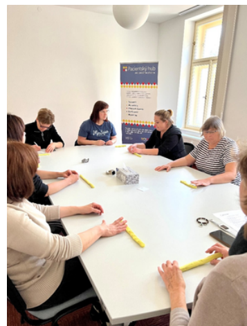
Rehabilitační WS v Praze

O podzimní rehabilitační workshop pro pacienty se systémovou sklerodermií a myozitidou byl veliký zájem a nás těší, že můžeme touto formou edukovat a motivovat pacienty k vlastní aktivitě ke zlepšení kvality života.